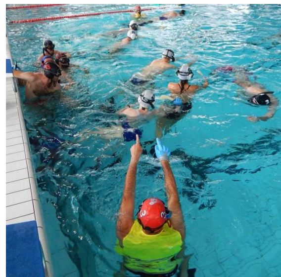
Die Verständigung erfolgt im Training und bei Turnieren per Handzeichen

3 m breit und können fürs erste mit je zwei Gegenständen markiert werden, z.B. mit Blei beschwerte Kunststoffdosen. Dann braucht man einen Puck mit 80 mm Durchmesser und 1.3 kg Gewicht. Dieser besteht aus Metall, das mit Kunststoff ummantelt sind. Die Spielerinnen und Spieler tragen die übliche ABC-Ausrüstung: Flossen, Taucherbrille und Schnorchel. Ein Handschuh aus Silikon schützt die Spielhand vor den Kanten der Fliesen und dem Puck, aber zu Beginn reichen