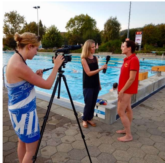
In diesem Film über unsere Junioren ist der Spielverlauf gut sichtbar:

der SRLG Kloten. Teilgenommen haben 1984 total 10 Teams aus SRLG Rafzerfeld, SRLG Horgen, SRLG Höngg, DRLG Friedrichshafen, Tauchclub Swissair, Sporttauchergruppe Nautilus Höri, Rettungsdienst Bielersee und dem USZ Zürich. All diese Clubs haben schon früh erkannt, wie sehr sich das Unterwasserhockey als Bereicherung für das Training aller Wassersportclubs eignet.