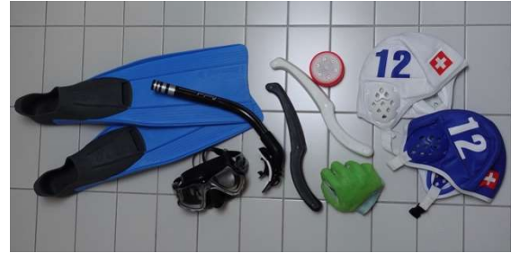
Unterwasserhockey kann mit wenig Material und praktisch in jedem Pool gespielt werden

3 m breit und können fürs erste mit je zwei Gegenständen markiert werden, z.B. mit Blei beschwerte Kunststoffdosen. Dann braucht man einen Puck mit 80 mm Durchmesser und 1.3 kg Gewicht. Dieser besteht aus Metall, das mit Kunststoff ummantelt sind. Die Spielerinnen und Spieler tragen die übliche ABC-Ausrüstung: Flossen, Taucherbrille und Schnorchel. Ein Handschuh aus Silikon schützt die Spielhand vor den Kanten der Fliesen und dem Puck, aber zu Beginn reichen