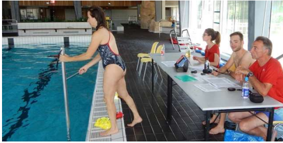
Bei einem Turnier startet die Spielleitung an Land das Spiel

Schachtel von 350 mm x 100 mm x 50 mm Platz haben. Sobald geübte Spieler den Puck vom Boden abheben und wegspicken können, „flicken“ genannt, ist auch ein Mundschutz am Schnorchel notwendig.