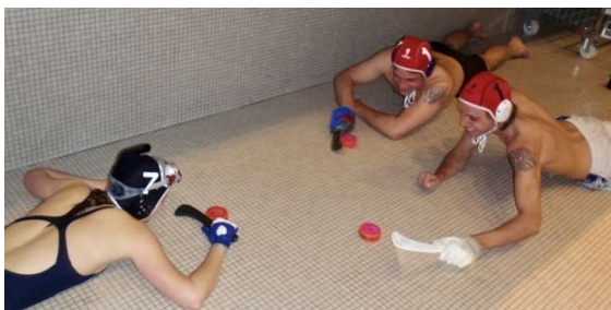
Eine kurze Einführung ins Unterwasserhockey reicht bereits aus, um mitspielen zu können

Bereits in den 80er Jahren gab es in der Schweiz den „Blöterli-Cup“, ein Unterwasserhockey-Turnier organisiert von