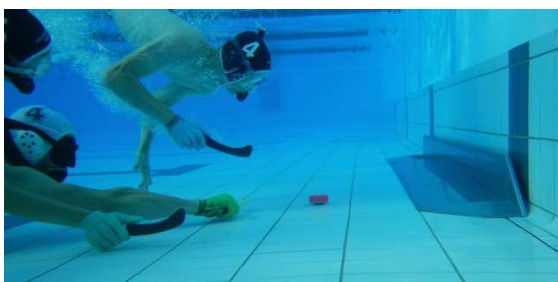
Die Tore sind 3 m breit

Unterwasserhockey kann mit einfachen Mitteln und praktisch in jedem Hallen-, Freibad oder Schulschwimmbecken gespielt werden. In den internationalen Regeln des CMAS ist das Spielfeld mit 21 – 25 m Länge, 12 – 15 m Breite und 2 – 3.65 m Tiefe definiert. Die Tore sind