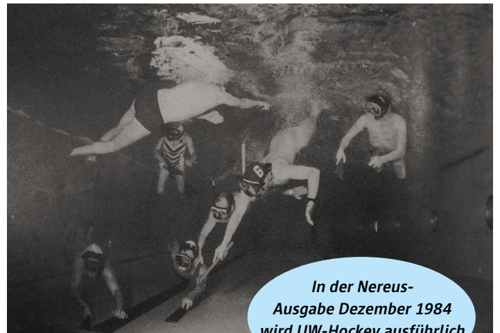
In der Nereus-Ausgabe Dezember 1984 wird UW-Hockey ausführlich beschrieben.