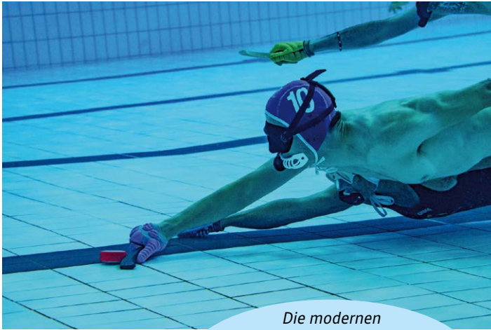
Die modernen Schläger, haben den Sport dynamischer gemacht und ermöglichen dabei weitere und präzisere Würfe.

Die Fahrt von Bern nach Basel war einfach. Danach wurde es schwieriger. Wegen etlichen Baustellen in Basel mussten wir gut planen, wie wir an einem Sonntag nach St-Louis gelangen konnten. Mit dem Tram sollte es am besten gehen, meinten wir. Die letzten vier Tramstationen befinden sich jedoch bereits auf französischem Boden. Das Ticket für diese letzten Tramstationen zu kaufen, wurde zu einer Kunst. Am Abfahrtort Bern war das nicht möglich. Der Ticketautomat im Basel wollte uns auch kein Ticket nach St-Louis verkaufen und gab nur Fehlermeldungen aus. Zum Glück führte uns danach jemand ins Mysterium Ticketautomat ein. Nur war in der Zwischenzeit das geplante Tram abgefahren. Naja, wir sind bewusst genug früh abgefahren.