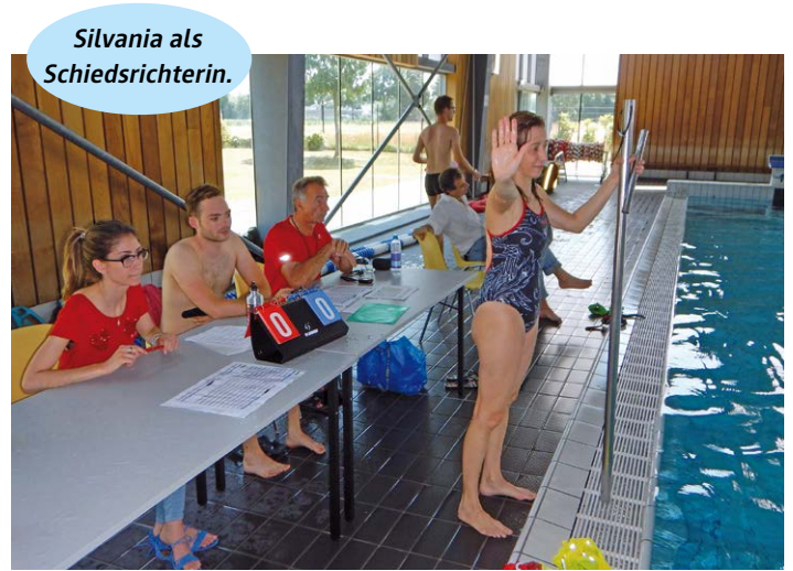
Silvania als Schiedsrichterin.

An der Trophy hat alles wunderbar geklappt. Die 23 Spiele (jedes Team gegen jedes, plus die beiden Finale) konnten innerhalb des Zeitplans gespielt werden. Das Finale Zürich 1 gegen Zürich 2 wurde zu einem Kopf an Kopf-Rennen. In der Verlängerung hat sich Zürich 1 schliesslich durchgesetzt und wurde Sieger, wenn auch erstaunlich knapp, war