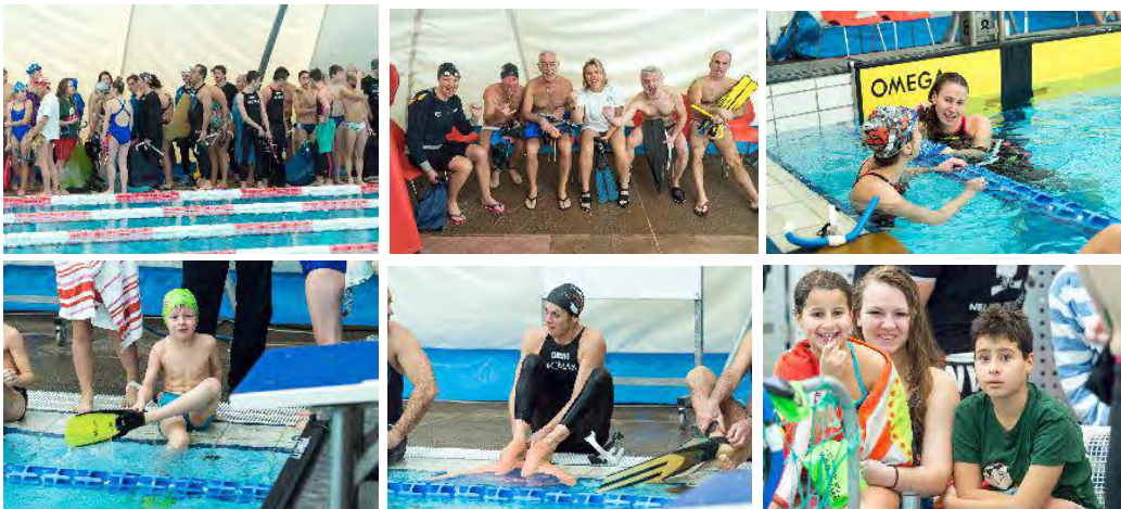
Swiss Open Championship 2017 – youngs & oldies

Im Jahr 2017 wurde das traditionell Coupe Indoors (25m Schwimmbecken) von Dauphins Genève in Meyrin organisiert; eine schöne Aufführung während des feiern zum Jubiläum der SLRG Oberwallis in Brig; das einzige offizielle Freiwasserflossenschwimmen, die Lugano Sub Trophy, vom selben Club in Paradiso organisiert, und die erfolgreiche Erfahrung, womit die Schweizer Meisterschaften zum ersten Mal in die bereits ausgetragene internationale Flippers Team Veranstaltung in Tenero als Swiss Open Championships integriert wurden.