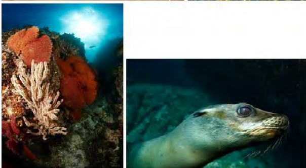
oben von links nach rechts: 10. Rang «Close up», «Weitwinkel mit Taucher», «Fisch» unten: «Weitwinkel ohne Taucher», «Close up Seelöwe»