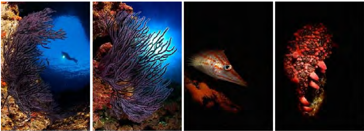
oben von links nach rechts: 2. Rang «Weitwinkel mit Taucher», 4. Rang «Weitwinkel ohne Taucher», 2. Rang «Fisch», «Close up» unten: «Close up Seelöwe»

Dieser gute Mix aus Lockerheit und Professionalität bescherte den Schweizern sicher auch ihre Erfolge. Die kleine Schweiz holte 4 Top-Ten-Platzierungen und eine Medaille. In jeder Kategorie, ausgenommen «Close Up Seelöwen», war die Schweiz in den 10 bestplatzierten Fotos mit dabei. Sehr gut machte es Marc Berset mit seiner Partnerin Géraldine Neglia. Denn sie holten den 2. Rang in der Kategorie «Weitwinkel mit Taucher». Diese gilt insgeheim als die Königsdisziplin in der Unterwasserfotografie. Da es nicht einfach ist sich so abzusprechen und zu «posen», dass am Ende ein schönes Foto entsteht. Dazu holte Marc noch zwei 4. Plätze in den Kategorien «Weitwinkel ohne Taucher» und bei «Fisch». Diese Resultate in den Kategorien sicherten Marc den 5. Rang in der Gesamtwertung. Markus konnte bei der Kategorie «Close Up» den 10. Rang belegen.