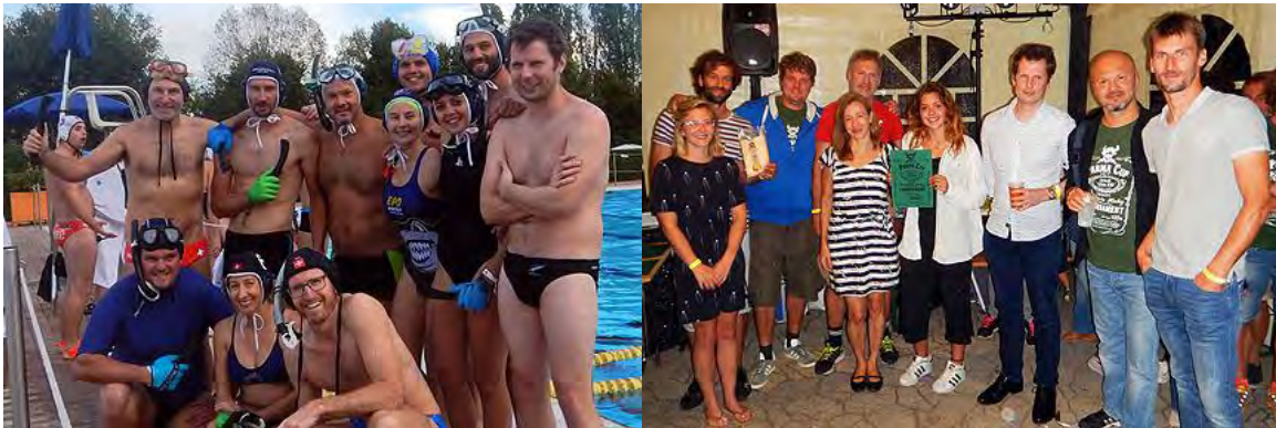
Unterwasserhockey Bern, als Teil der "Swiss Mix", beim 10. Parmacup, Parma, Italien

Schweizer Unterwasser-Sport-Verband SUSV Fédération Suisse de Sports Subaquatiques FSSS Federazione Svizzera di Sport Subacquei FSSS Federaziun Svizra da Sport Subaquatic FSSS