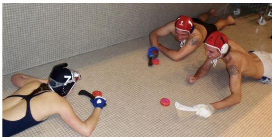
Una breve introduzione all'hockey subacqueo è già sufficiente per poterlo provare.

In un torneo ufficiale, una partita dura tempi da 15 minuti ciascuno con una pausa di 3 minuti a metà. Due arbitri in acqua si assicurano che il disco venga manovrato solo con il bastone e che nessuno ostacoli il gioco trattenendo, bloccando, tirando l'attrezzatura o altre simili violazioni del regolamento. Il terzo arbitro si posiziona a bordo vasca da dove dirige il gioco. L'hockey subacqueo prevede anche le consuete sanzioni previste in tutti gli sport di squadra, come ammonizioni, calci di punizione o penalità.