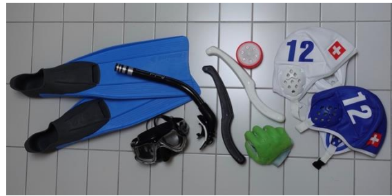
L'hockey subacqueo può essere praticato con poca attrezzatura e praticamente in qualsiasi piscina.

campo di gioco come lungo 21-25 m, largo 12-15 m e profondo 2-3,65 m. Le porte sono larghe 3 m e possono essere marcate con due oggetti ciascuna, ad esempio lattine di plastica appesantite con piombo. È poi necessario un disco che abbia diametro di 80 mm e un peso di 1,3 kg, di metallo ricoperto di plastica.