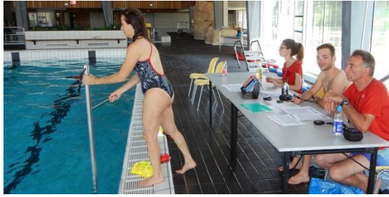
In un torneo, la gestione delle partite a terra inizia la partita.

Da regolamento, un bastone dovrebbe poter entrare in una scatola immaginaria da 350 mm x 100 mm x 50 mm. Dal momento che con un "flick" (il tipico gesto tecnico dello sport con cui si tira o passa il disco) è possibile imprimere un traiettoria a parabola e sollevare il disco da terra di parecchi cm, è necessario anche un paradenti sullo snorkel per proteggersi da eventuali infortuni.