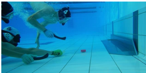
I cancelli sono larghi 3 m

L' hockey subacqueo può essere praticato con mezzi semplici e praticamente in qualsiasi piscina interna, esterna o scolastica. Le regole internazionali CMAS definiscono il