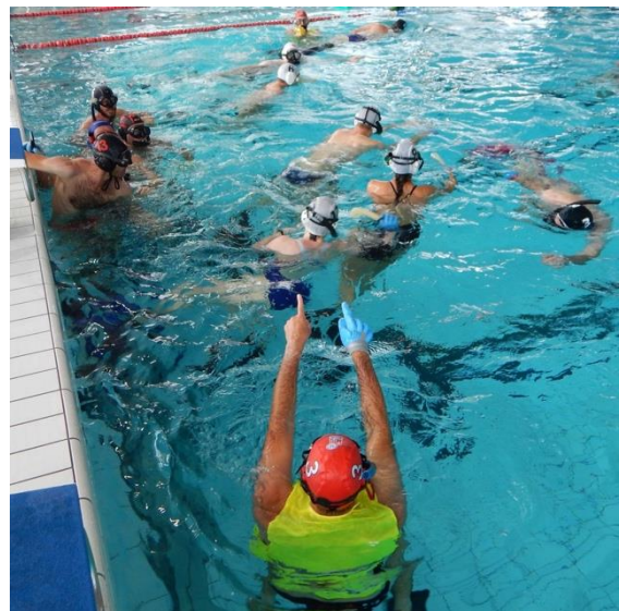
La comunicazione durante gli allenamenti e i tornei avviene tramite segnale manuale.

I giocatori indossano la consueta attrezzatura ABC (da snorkeling?): pinne, occhiali da sub e boccaglio. Un guanto di silicone protegge la mano che