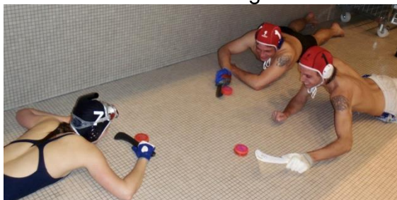
Une brève introduction au hockey subaquatique suffit pour pouvoir jouer.

En suisse le hockey subaquatique est déjà présent depuis les années 80. En 1984 le club de sauvetage de Kloten à