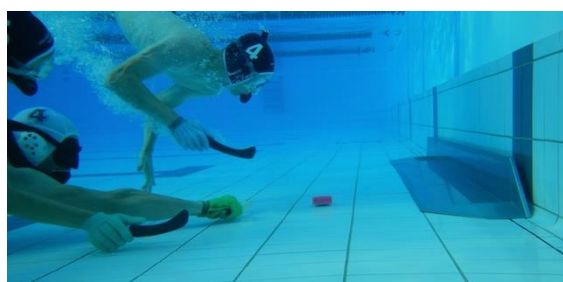
Les buts font 3m de large

Le hockey subaquatique peut être pratiqué avec des moyens simples et pratiquement dans n'importe quelle piscine intérieure, extérieure ou scolaire. Les règles internationales de la CMAS prévoient un terrain de 21 à 25 m de long, 12 à 15 m de large et 2 à 3,65 m de profondeur. Les buts ont une