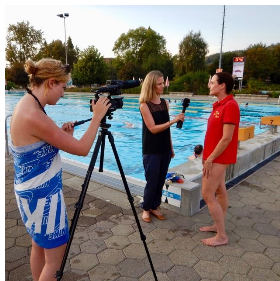
Dans ce film sur nos juniors, le déroulement du match est bien visible : www.bern-ost.ch Mot à rechercher : Unterwasserhockey

organisé la „Blöterli-Cup“, où 10 clubs ont participé : SSS Rafzerfeld, SSS Horgen, SSS Höngg, SSS Friedrichshafen, le club de plongée de swiss-air, le club de plongée sportive de Nautilus Höri, le service de sauvetage du lac de Bienne et USZ Zurich. Tous ces clubs ont compris très tôt à quel point le hockey subaquatique pouvait être un domaine d'entraînement pour tous les clubs de sports aquatiques.