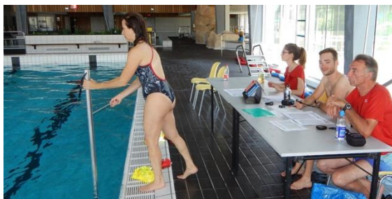
Lors d'un tournoi, le meneur de jeu à terre lance le jeu

une ou deux sessions d'entraînement les joueurs sont assez expérimentés pour pouvoir faire des tirs en cloche avec le puck, aussi appelés « flick ». A ce moment il est nécessaire d'avoir une protection au niveau de la bouche. Cette protection se place sur le tuba, voir la première image.