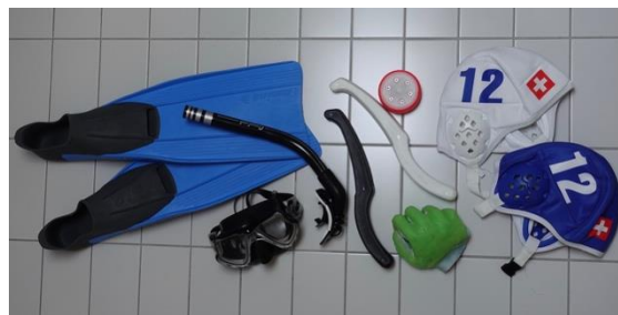
Le hockey subaquatique peut être pratiqué avec peu de matériel et pratiquement dans n'importe quelle piscine.

largeur de 3 m et peuvent être marqués dans un premier temps avec deux objets chacun, par exemple des boîtes en plastique lestées de plomb. Ensuite, il faut un palet de 80 mm de diamètre et de 1,3 kg. Celui-ci est en métal recouvert de plastique. Les joueurs portent l'équipement de base pour la plongée : des palmes, un masque et un tuba. Un gant avec des renforts en silicone protège la main qui joue des bords du carrelage et du puck, mais au