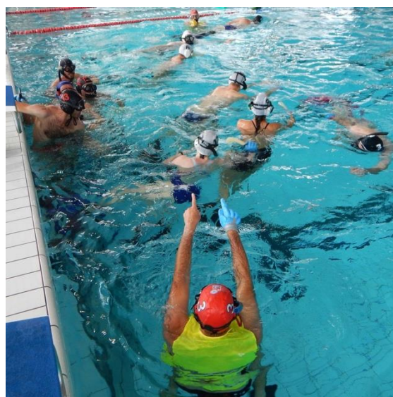
La communication se fait par signes à l'entraînement et lors des tournois

largeur de 3 m et peuvent être marqués dans un premier temps avec deux objets chacun, par exemple des boîtes en plastique lestées de plomb. Ensuite, il faut un palet de 80 mm de diamètre et de 1,3 kg. Celui-ci est en métal recouvert de plastique. Les joueurs portent l'équipement de base pour la plongée : des palmes, un masque et un tuba. Un gant avec des renforts en silicone protège la main qui joue des bords du carrelage et du puck, mais au