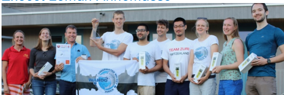
Wahoo Underwater Hockey Zürich

In meinen Spielpausen versuchte ich Tore und elegante Posen fotografisch einzufangen. Wenn die Teams nicht gleich stark waren, wusste ich vor welchem Tor ich warten musste, um einige tolle Torschüsse zu erwischen. Insgesamt hielt ich mich dadurch ziemlich lange im Wasser auf, was auch die beste Sonnencreme irgendwann wirkungslos macht. Das nächste Mal werde ich jedenfalls mein Neoprenshirt nicht mehr zuhause liegen lassen!