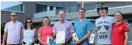
Flying Fish Kloten

Im Finale konnte sich Wahoo gegen Exocet Léman durchsetzen, womit der Pokal für ein weiteres Jahr in der Vitrine im Hallenbad Oerlikon stehen wird.