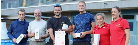
Plongée des Trois Frontières Saint-Louis