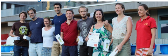
Exocet Léman Annemasse