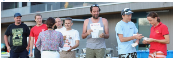
Strasbourg Hockey Subaquatique