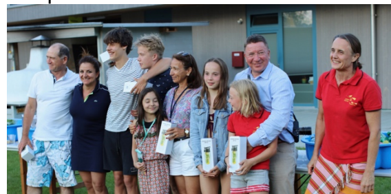
Vielen Dank an alle Helfer

Vielen Dank an alle Helfer, Helfershelfer, Zeitmesser, Schiedsrichter, Fotografen, Getränkeholer und Organisatoren. Der ganze Anlass hat wunderbar geklappt und wir fühlten uns alle pudelwohl.